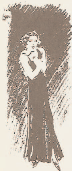
Enfin Damia paraît...

— Tu crois que c'est un ménage, ces deux trapézistes-là ? demande déjà amoureux, déjà inquiet, déjà jaloux, un petit jeune homme blond platine à un autre petit jeune homme blond platine qui lui ressemble comme un frère, mais qui heureusement n'est pas son frère, ce qui leur permet à tous deux de ne pas verser dans le péché de l'inceste.