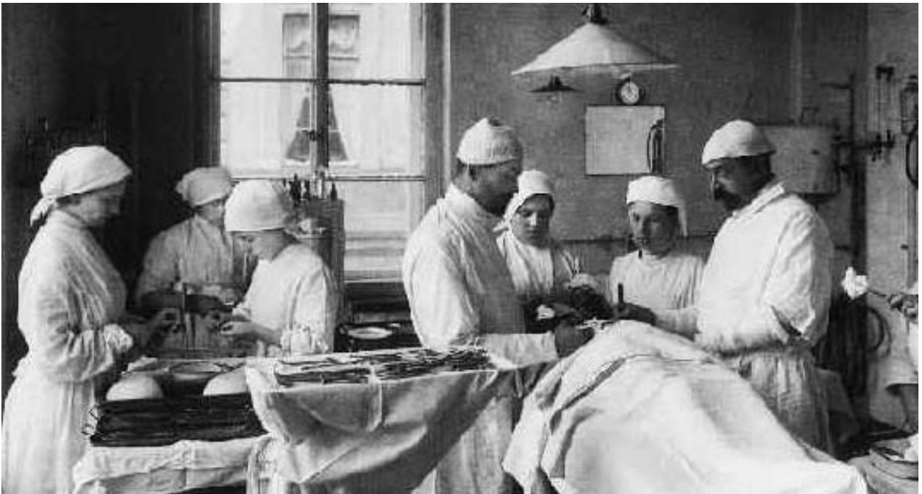
Salle d'opération (hors texte)

De ses doigts gantés L. souleva une paupière. Un iris d'un bleu pur apparut, lumineux, intense, presque insoutenable.