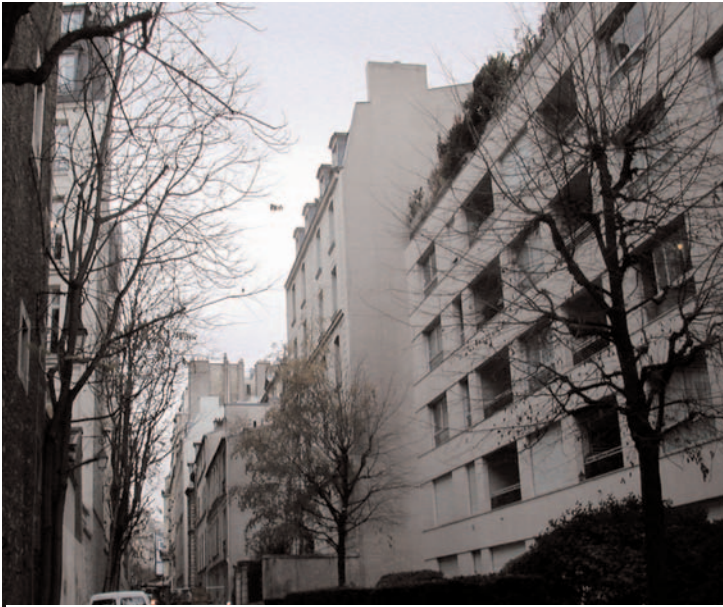
Avenue Beaucour (vue vers la sortie)