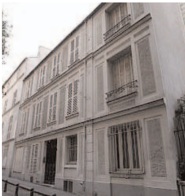
9/11, avenue Beaucour

N° 9 et 11 : Anciennes maisons faubouriennes rénovées par Emmaüs pour servir de résidence pour jeunes travailleurs. Après la guerre de 14-18, le romancier Gustave Le Rouge (1867-1938) vécut quelque temps à cette adresse où lui rendit visite le poète Blaise Cendrars .