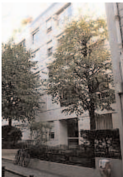
15/15 bis avenue Beaucour

N° 17 ter : En décembre 1922, Georges Simenon prend à la gare des Guillemins de Liège, le train de nuit pour Paris; au petit matin,