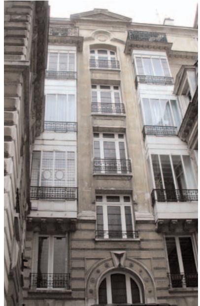
7, avenue Beaucour

Le premier pigeon qui tomba dans leurs filets fut un personnage de premier plan, doré sur tranche, plusieurs fois ministre, dont elles firent leur faire-valoir et leur toutou. Leur ambition plus haute les amena à détourner les ardeurs de leur amant vers de gentes amies étrangères, complaisantes et complices, dont ce fin lettré parlait la langue. Elles s'attaquèrent alors à un gibier plus haut placé dans la