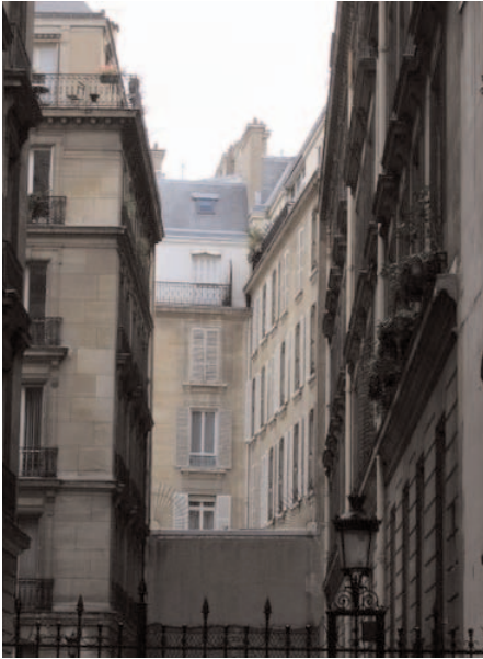
Fond de l'avenue