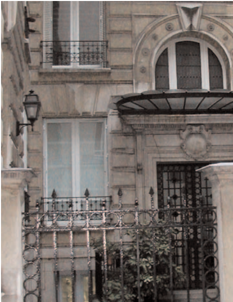
7, avenue Beaucour

N° 7 : Immeuble solennel, en U, un peu guindé, édifié en 1892 par l'architecte suisse Henri Fivaz, amoureux des bow-