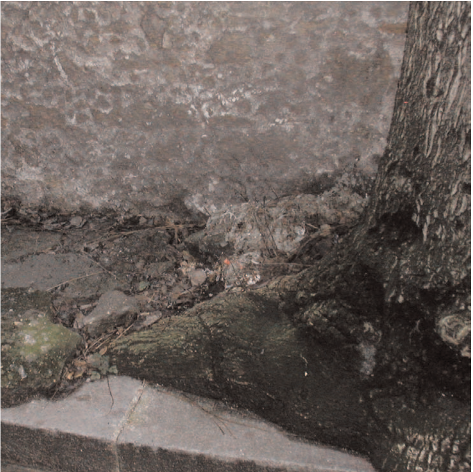
Arbre à maléfices

Une rumeur prétend que parfois, au cours de nuits sans lune, des sorciers enterraient au pied d'un certain arbre de l'avenue, des gris-gris chargés de maléfices, dont ils attendaient qu'ils affaiblissent la cible de leur envoûtement. Le fait est que de nos jours encore l'on ressent un malaise à la vue des traces d'incision infligées au tronc de l'arbre et au sinistre moignon de racine gluant, infesté de parasites.