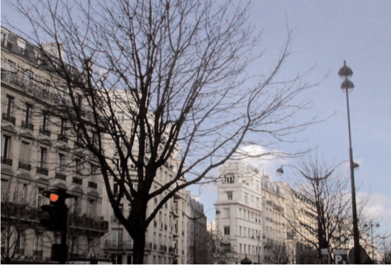
Vue de l'entrée de l'avenue Beaucour au carrefour Hoche/Faubourg St Honoré

VIII e arrondissement. Son entrée se situe au 248, rue du Faubourg-Saint-Honoré à la hauteur du n°16 de l'avenue Hoche. Cette ancienne voie privée qui finit en impasse fut créée en 1825 sous le nom d' impasse Beaucour , patronyme du propriétaire du terrain. Elle fut ouverte à la circulation publique en 1959. Longueur 228 mètres; largeur : 6 mètres. (Source : Jacques Hillairet)