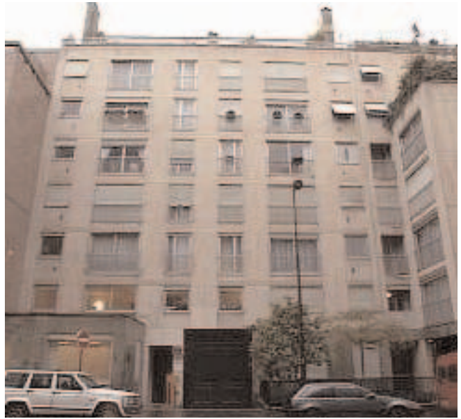
Le n° 25 de la rue Chazelles en 2005

Fille d'un fermier normand de la région de Dieppe, Frisette dirigeait d'une main de fer, au "Sébastol", alors quartier des Halles centrales, une trentaine de filles aux spécialités bien établies.