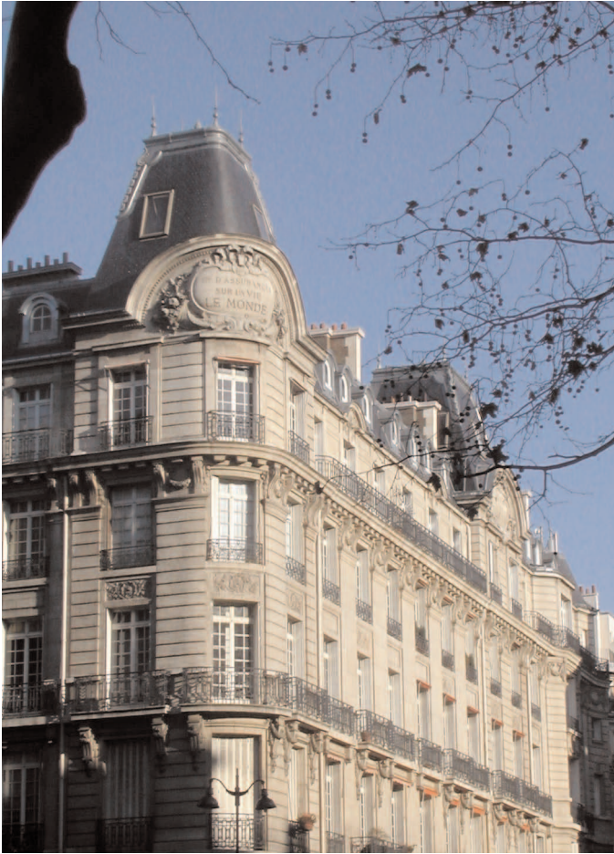
Angle rue de Chazelles (n°1) et bd. de Courcelles

XVII e Arrondissement. Commence 94 bd de Courcelles; finit 15-19 r. de Prony. Longueur 315 mètres; largeur 12 mètres. Ancienne voie de la commune des Batignolles. Cette rue fut ouverte avant 1846 pour relier la rue de Courcelles à la route d'Asnières (aujourd'hui rue de Tocqueville), mais, en 1860, elle n'avait pas encore dépassé la place Malesherbes. Depuis, elle fut fort amputée.