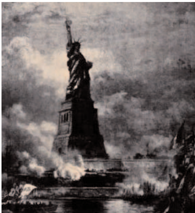
Inauguration de la statue de la Liberté

Remontée et rivetée sur un socle de granit, sous la direction de l'archi-