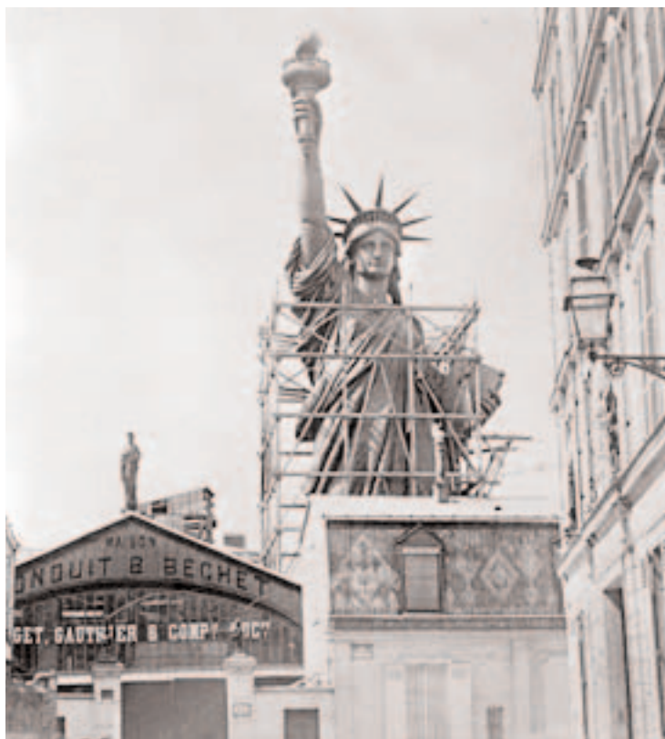
La statue de la liberté en construction

fragments énormes, et c'est, de tous côtés, comme la dissection de Brobdingnac par des charpentiers ou des ouvriers marteleurs.»