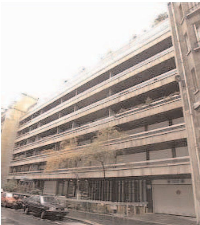
Le n° 25 de la rue Chazelles en 2005

Ce sont ses rapports et ses entretiens avec cet éminent savant qui développèrent en lui le goût de la Recherche Scientifique, notamment dans le domaine des ondes auxquelles il se consacra entièrement.