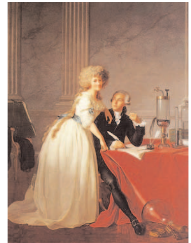
Lavoisier et son épouse

c h i m i s t e A n t o i n e - L a u r e n t L a v o i s i e r et était devenue sa dévouée colla- boratrice. Onze ans après sa mort tragique – il fut guillotiné