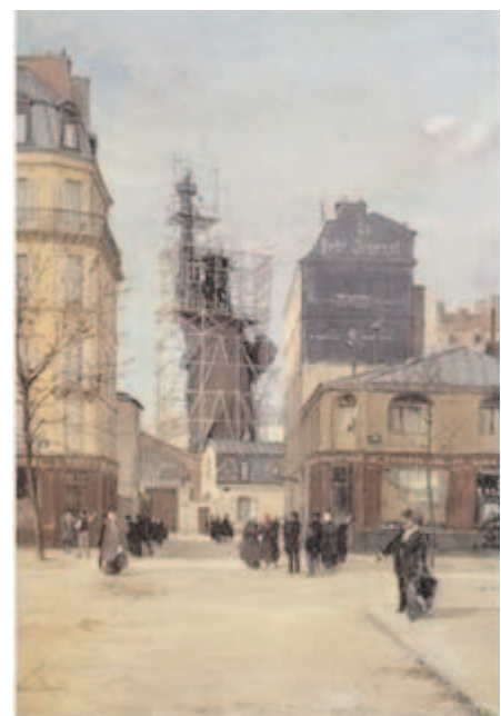
Les badauds affluent rue de Chazelles