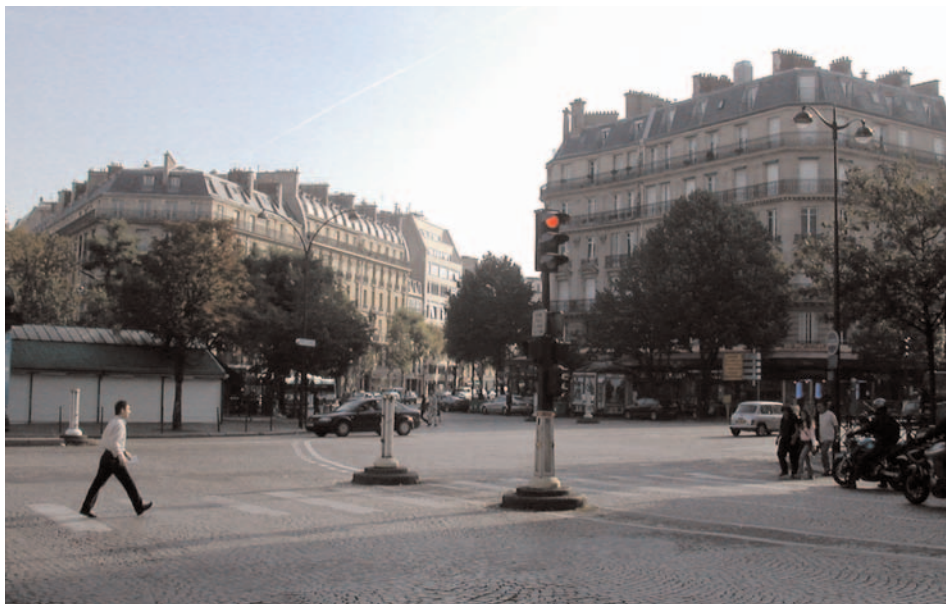
Entrée boulevard de Courcelles côté place des Ternes

VIII e et XVII e Arrondissements. Commence 3 place Prosper-Goubaux; (Villiers) finit 4 place des Ternes. Longueur 1285 m (ajourd'hui 1160); largeur minimum 36 m. Ancienne voie de la commune des Batignolles et de la commune de Neuilly, elle longe le parc Monceau.