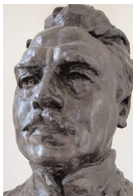
Henri Becque par Rodin

Un matin de novembre 1908, Sardou, son légendaire béret de velours noir sur la tête, son foulard rouge autour du cou, quitta son rez-de-chaussée luxueux et confortable pour se rendre à deux pas de chez lui, au carrefour Villiers: on allait y dévoiler le buste de Henri Becque, par Rodin . Une tribune officielle avait été dressée, où l'auteur de Patrie avait sa place réservée. Mais il arriva en retard et fut arrêté par un barrage de police. Il resta dans la foule, piétinant sous la bise d'hiver où s'envolaient des lambeaux de discours. Il rentra chez lui gelottant et prit le lit pour ne plus se relever.»