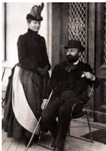
Ernest Chausson et son épouse

N° 2 : Le peintre et miniaturiste Renée de Miremont (1868-1918) habita à cette adresse. Lors de l'exposition Universelle de 1900, sa collection de "boutons" ornés des portraits des célébrités de la Belle Époque fut acquise par le Tzar.