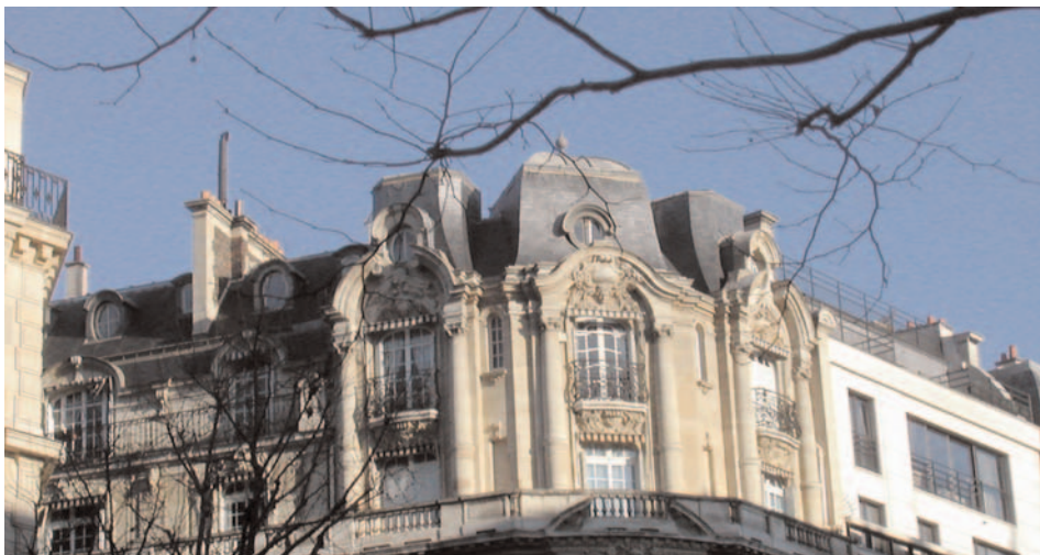
102, boulevard de Courcelles