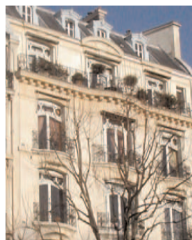
72, bd de Courcelles

N° 72 : Gaston Calmette (1858-1914), directeur du Figaro, demeura dans cet immeuble. Le 16 mars 1914, Paul Bourget, qui sortait du bureau de Gaston Calmette, rue Drouot, croisa