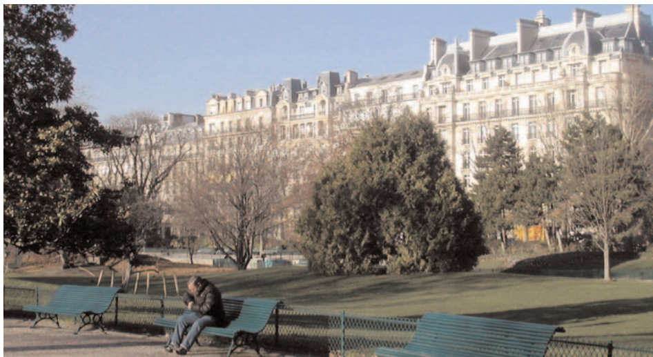
Boulevard de Courcelles vu du parc Monceau

VIII e et XVII e Arrondissements. Commence 3 place Prosper-Goubaux; (Villiers) finit 4 place des Ternes. Longueur 1285 m (ajourd'hui 1160); largeur minimum 36 m. Ancienne voie de la commune des Batignolles et de la commune de Neuilly, elle longe le parc Monceau.