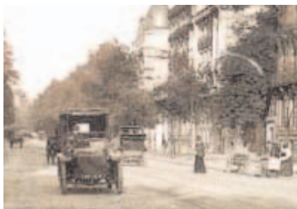
Boulevard de Courcelles (1914)

N° 34 : Ex-hôtel Lambert de Sainte-Croix, résidence de l'ambassade d'Espagne, installée à la fin du XIX e siècle 53 rue Saint-Dominique. Le roi d'Espagne y descendit en 1905. «C'est devant cette ambassade que vint défilé; en 1909, un cortège conduit par Edouard Vaillant, Jean Jaurès, Marcel Sembat, Charles Albert, et qui venait protester