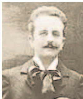
Robert de Flers

N° 70 : Immeuble où habita le marquis Robert de Flers (1872-1927) – (cf. n° 40), époux de Geneviève Sardou. Il était le voisin de son beau-père, dont les fenêtres s'ouvraient au rez-de-chaussée du n° 64. «L'interprète préférée de Robert de Flers fut Eve Lavallière. Quand, faisant chaque année une cure à Vittel, on ne le voyait pas de toute une journée paraître dans le parc de la station, on pouvait être sûr qu'il était parti pour Saint-Baslemont, au village de Thuillières où la comédienne passait l'été dans la propriété de son directeur aux Variétés, Samuel. Il était allé lui lire une de ses comédies et lui demander son avis sur le rôle qu'il lui destinait. Plus tard, il devait revenir fidèlement à Thuillières, mais cette fois dans