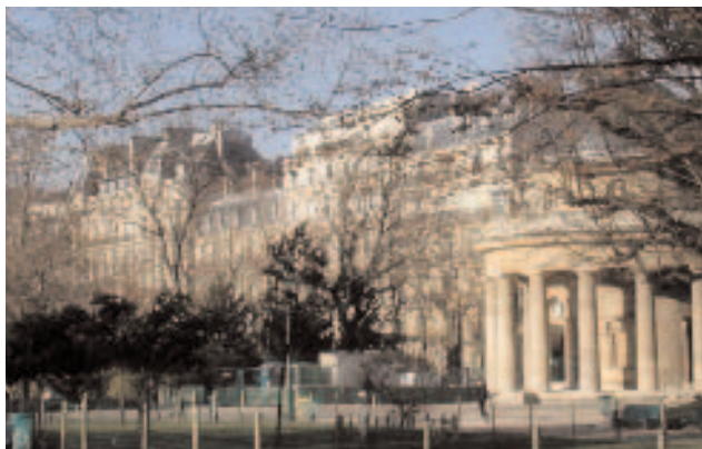
33, bd de Courcelles vue actuelle depuis le parc

"Toutes les institutions sociales doivent avoir pour but l'amélioration intellectuelle, morale et physique de la classe la plus nombreuse et la plus pauvre."