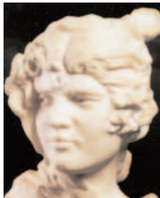
Œuvre de Réal del Sarte

N° 88 : Une famille d'artistes habitait dans cet immeuble. Désiré Réal del Sarte était sculpteur, Mme Réal del Sarte faisait de la peinture. Leur fils aîné, Maxime (1888-1954), était le statuaire attitré de L'Action Française . De sa main unique - il avait perdu l'autre dans les combats de la guerre de 1914 - il modela des œuvres dont la plupart devaient naturellement refléter le climat de ses convictions politiques.