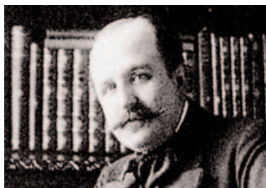
Gaston Arman de Caillavet

N° 40 : Immeuble où habitait en 1910 Gaston Arman de Caillavet* (1869-1915), fils de l'égérie d'Anatole France et signataire, avec Robert de Flers, d'agréables comédies légères parues durant le premier quart du XXe siècle, qui restent autant de symboles de ce qu'il est convenu d'appeler le théâtre de boulevard !