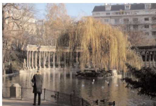
Naumachie avec vue actuelle au fond du n°33, bd de Courcelles

cent cinquante ans et une arcade Renaissance provenant de l'Hôtel de Ville de Paris brûlé par la Commune en mai 1871. (Cf. Parc Monceau ) ( Jacques Hillairet ).