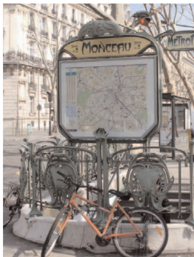
Bd de Courcelles Métro Monceau

Ce boulevard, dont le nom vient du hameau de Courcelles, sur la route de Villiers, et au voisinage de la rue de Courcelles. Il a été formé, en 1863, par la fusion des boulevards et du chemin de ronde qui suivaient, extérieurement et intérieurement, le mur des Fermiers Généraux depuis la barrière de Monceaux jusqu'à la barrière du Roule, Ceux-ci s'étaient appelés respectivement, les premiers boulevard de Monceaux entre l'avenue de Villiers et la rue de Courcelles et boulevard de Courcelles pour le surplus; le second: chemin de ronde de Courcelles entre la rue de Courcelles et l'avenue de Wagram, Le mur des Fermiers-Généraux comportait 54 portes donnant accès à la ville de Paris. Il était percé dans le quartier de trois barrières : la barrière de Monceaux, place Prosper-Goubaux, au débouché des rues du Rocher et de Valois (Monceau), faite d'un bâti-