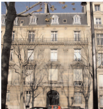
64, boulevard de Courcelles

Liberté et entre en politique pour lutter contre le «radicalisme dreyfusard et le collectivisme internationaliste». Il prend une part active à la discussion sur le projet de séparation des Églises et de l'État qu'il rejettera.