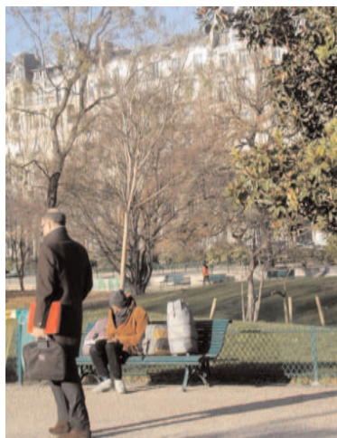
Cadre et poète

rotonde à colonnade, dite le pavillon de Chartres, qui servit de poste d'observation aux gardiens d'octroi préposés à la surveillance des abords extérieurs du mur des Fermiers-Généraux. C'était un poste de guet dans la calotte duquel le duc de Chartres se fit aménager un salon d'où il eut une vue très étendue sur la plaine de Monceaux. Ce pavillon est classé.