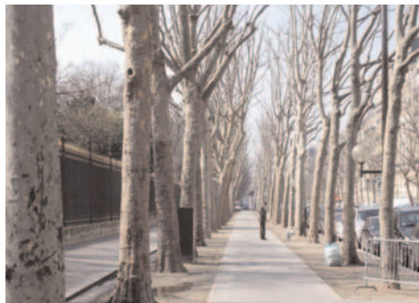
Bd de Courcelles : grille du parc Monceau

Pour mieux s'opposer à la contrebande, ce fossé fut pourvu, à son saillant, d'une