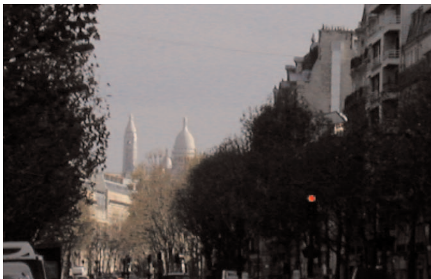
Boulevard de Courcelles vue sur le Sacré-Coeur

ment à deux péristyles ornés de colonnes à bossages; la barrière de Courcelles, au débouché de la rue de Courcelles, faite d'un bâtiment, inspiré du temple de Pæstum, orné sur son pourtour de 24 colonnes; la barrière du Roule, place des Ternes, au débouché de la rue du Faubourg-du-Roule (Saint-Honoré), faite d'un bâtiment à quatre avant-corps surmonté d'un dôme. Trois carrefours du boulevard de Courcelles l'ont stupidement mutilé, par la création artificielle à 3 de ses carrefours, des places de la République dominicaine, de la république de l'Equateur, et de la place Prosper Goubaux au carrefour de Villiers !