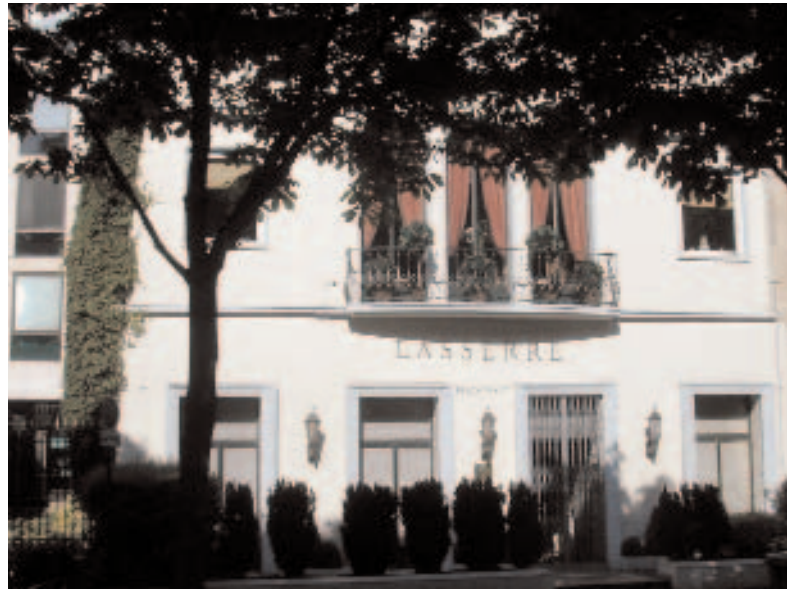
17, ave. Franklin-Roosevelt