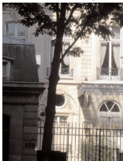
9, ave. Franklin-Roosevelt

N° 17 : La vie de René Lasserre * (1912-2006) est exemplaire. C'est celle d'un gamin de Bayonne "monté" à Paris à l'âge de 12 ans, maître d'hôtel à 19, qui bâtit à force de travail et d'intelligence, à partir d'un modeste bistrothangar édifié pour l'exposition universelle de 1937, un établissement de