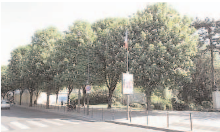
2, ave. Franklin-Roosevelt (Place du Canada)

décéda le 12 avril 1945, avant la Victoire des forces alliées et la fin de son quatrième mandat.