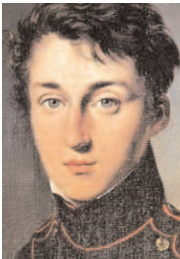
Sadi Carnot (Jeune)

N° 19 : Le président Marie-François Sadi Carnot (1837-1894) résida ici avant d'accéder à la magistrature suprême en 1887. Il fut assassiné d'un coup de poignard à Lyon par l'anarchiste italien Sante Caserio suite à son refus d'accorder la grâce d'Auguste Vaillant auteur d'un attentat à la Chambre des Députés en 1893.