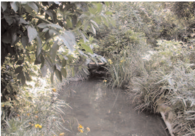
Jardin Anne Sauvage (anciennement Jardin de la Vallée suisse)

(Anciennement appelé Jardin de la Vallée suisse en souvenir du pavillon helvétique d'une des Expositions universelles qui se dressait non loin de là).