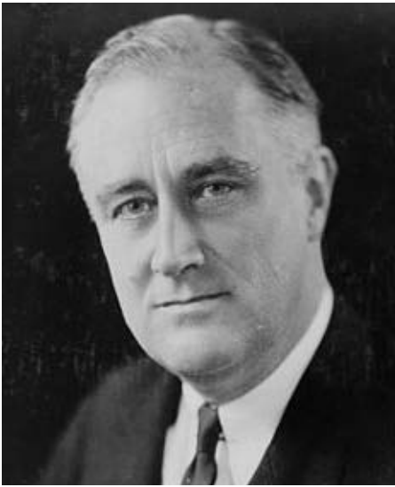
Franklin Delano Roosevelt

VIII e Arrondissement. Cette belle avenue qui commence près de la Seine face au pont des Invalides, à la jonction du Cours-la-Reine, du Quai Albert I er et de la rue François I er , carrefour baptisé aujourd'hui place du Canada , finit sur la place Chassigne-Goyon , devant l'église Saint-Philippe-du-Roule, au croisement des rues La Boétie et du Faubourg-Saint-Honoré. Longueur 880 m; largeur 19,50 à 24 m.