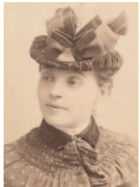
Réjane par Nadar