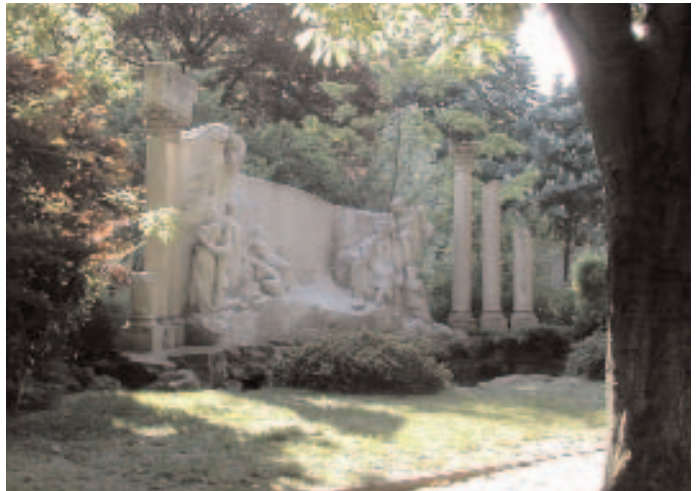
Le Rêve du Poète

En contrebas de la Place du Canada, derrière le monument dédié à Alfred de Musset, qui borde l'avenue Franklin-Delano-Roosevelt, le promeneur découvrira le ravissant et surprenant Jardin Anne-Sauvage . Ici, entre deux berges fleuries envahies d'une végétation exubérante, serpente un ruisseau