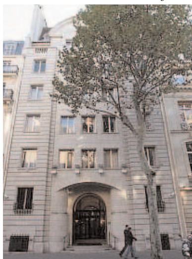
26, ave. Franklin-Roosevelt

La gloire de Poiret fut naturellement payée par d'énormes pertes d'argent et il finit dans la pauvreté. Deux images me restent de la fin de sa vie: une présentation de modèles de confection dont, vieilli, à demi infirme, il accepta de se faire l'appariteur dans un grand magasin; et puis, dans un estuaire breton, un yacht échoué, démâté, pourrissant, tout ce qui restait du joli bateau où le fait d'y avoir été