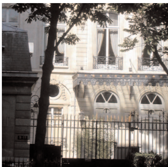
9, avenue Franklin-Roosevelt