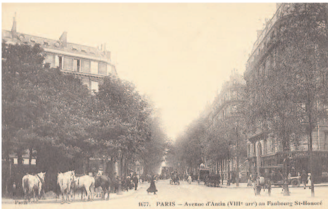
L'avenue Franklin-Roosevelt lorsqu'elle s'appelait Avenue d'Antin, vue de St Philippe-du-Roule au début du XX e siècle

N° 71 : Pierre Benoit* (1886-1962) grand-reporter et romancier célèbre, - il est l'auteur entre autres de Kœnigsmark puis de L'Atlantide - vécut ici ses dernières années parisiennes avant de se retirer à Ciboure, dans ses chères Pyrénées.