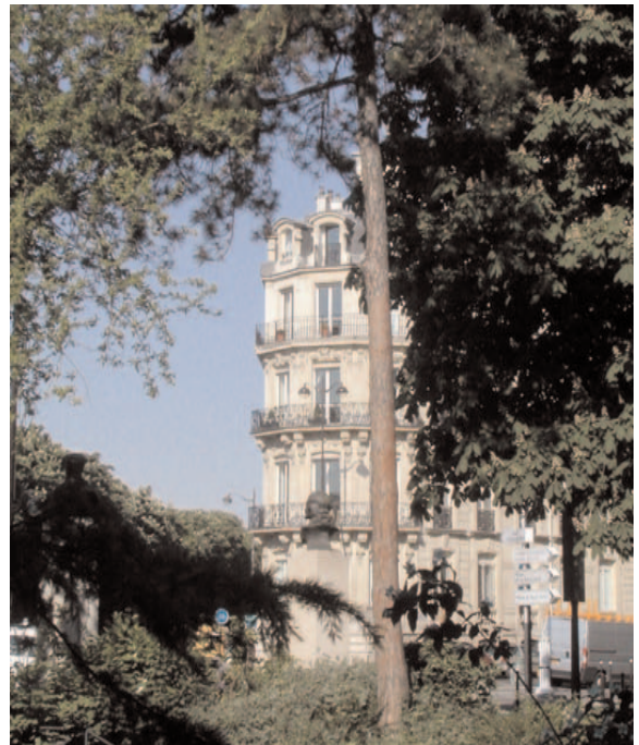
1, rue Franklin-Roosevelt (Place du Canada)

Franklin Delano Roosevelt est le trente-deuxième président des États-Unis. Seul président à avoir été élu pour quatre mandats successifs il eut à gérer les conséquences de la Grande dépression initiée par le krach boursier de 1929 en mettant en œuvre le New Deal une mesure qui influença durablement le pacte social américain. Responsable de la politique des États-Unis pendant la Seconde Guerre mondiale, il