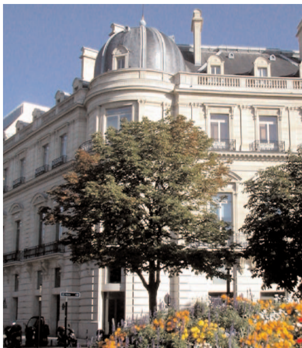
Rond-Point des Champs-Élysées

une carrière brillante au Palais-Royal et aux Variétés. Pour être juste, il faut dire qu'elle devait aussi son renom à ce qu'elle était suprêmement élégante... et un des plus beaux ornements de l' Omnibus de Maxim's.