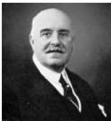
Marquis de Dion

Fondatriceur en 1898 du Salon de l'Auto , cofondateur de l' Automobile Club et de l' Aéro-club de France , il créa également le journal L'Auto en 1900.