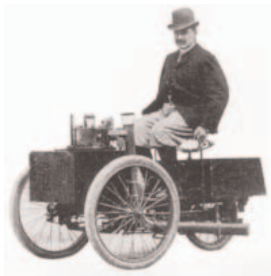
Jules Albert de Dion

Organisateur-né, touche-à-tout de génie, toujours sur la brèche et bouillonnant d'idées, le fringant marquis de Dion était d'une nature plutôt vive qu'André de Fouquières qui assista à la scène, nous décrit avec gourmandise : «un soir qu'en sa présence Aurélien Scholl médissait d'une dame de ses amies, le marquis brisa une bouteille de champagne sur la tête du chroniqueur indiscret.» Avec ses associés complices Georges Bouton et Georges Trépardoux de Dion fut durant quelques mois, après la guerre de 14-18, l'un des plus grands fabricants de voitures au monde.