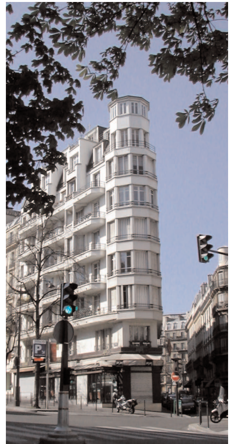
14 ave Mac-Mahon - 14, Gén Lanrezac