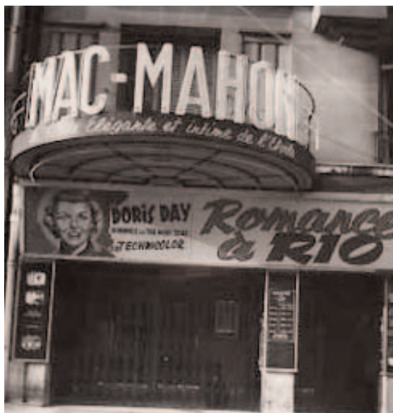
Le cinéma Mac Mahon en 1953

enfants. Aujourd'hui, le Mac-Mahon se partage entre la programmation des grands films du répertoire et l'organisation, en semaine, d'avant-premières, de rencontres et de débats.