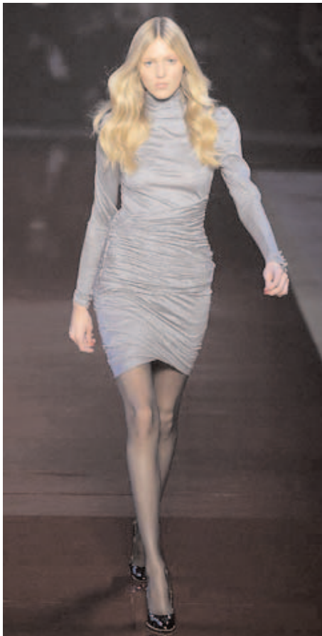
Une création d'Ungaro