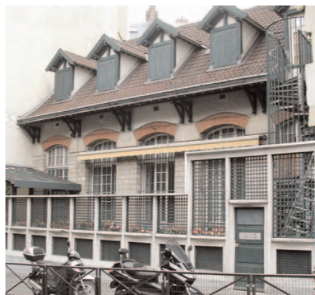
18bis, avenue Mac-Mahon

barbe assyrienne et sa toison bouclée qui blanchit brusquement lorsqu'il eut le malheur de perdre son fils en 1915. Faisant partie du Club des Hydropathes , il fut de ceux qui prirent parti contre Rodin lors de la polémique qui s'institua autour de la statue de Balzac.