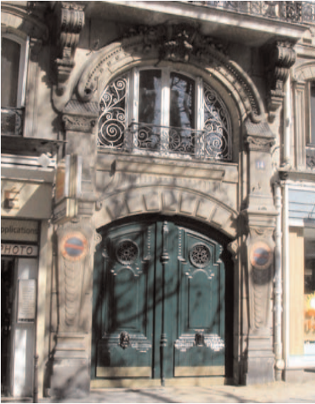
14, avenue Mac-Mahon