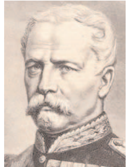
Patrice de Mac-Mahon

Alors qu'il allait passer en revue les élèves de l'École spéciale militaire de Saint-Cyr, Mac-Mahon fut informé que le soldat le plus brillant de la promotion était noir de peau. Or, à Saint-Cyr le mot "nègre" désigne depuis le XIX e siècle le "major", c'est-à-dire l'élève le plus doué de la promotion. Arrivé devant le jeune homme, Mac-Mahon lui lança : "Ah c'est vous le nègre ?". Et à court d'imagination, il ajouta : "Très bien, continuez!".