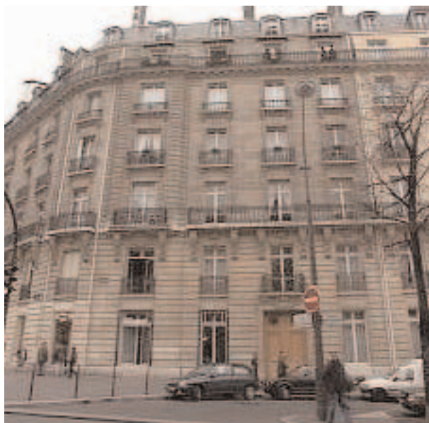
19, avenue Mac-Mahon

Quand on avait traversé le jardinet de l'avenue Mac-Mahon, on entrait dans une salle meublée de bancs de bois et aux murs de laquelle était écrit le nom de Krisna en lettres d'or. Le Zouave entrait et invoquait Krisna en imposant à la clientèle une demi-heure de silence et d'immobilité. Après quoi, il passait entre les bancs, demandait à chacun de lui désigner le siège de la souffrance endurée. Alors il "imposait les mains"... avec énergie, c'est-à-dire en envoyant une gifle magistrale sur les points douloureux. Le mal se dérobaît lâchement sous ces voies de faits et chacun se déclarait guéri. Peut-être pour que le Zouave n'imposât pas les mains une seconde fois! Ce brave homme ne mourut qu'en 1913.» Sa tombe au cimetière de Gentilly situé 7, rue de Sainte-Hélène dans le 13 e arrondissement est toujours fidèlement