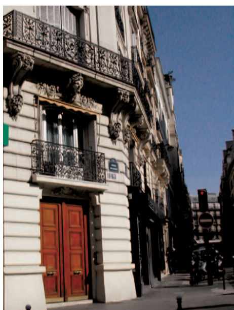
12bis, avenue Mac Mahon

N° 12bis : Ce fut à l'angle 12 bis de l'avenue Mac-Mahon et du n°24 de la rue Troyon que la vie d' Édith Piaf* bascula pour devenir un conte de fée.