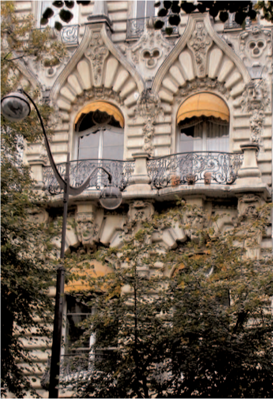
29, avenue Mac-Mahon

propriétaire et architecte décidèrent de surélever l'édifice de trois nouveaux étages dans le même goût très particulier mais atténuant quelque peu le décor théâtral de la construction initiale. Dans cette façade curieuse par l'exagération même de tous ses détails, Massa nous offre la franchise d'un décor à la fois classique et très recherché, paraissant se rapprocher de l'Art Nouveau sans y toucher vraiment, brouillant volontairement les cartes, tout en se divertissant en allusions gourmandes et en clins d'œil d'initié.