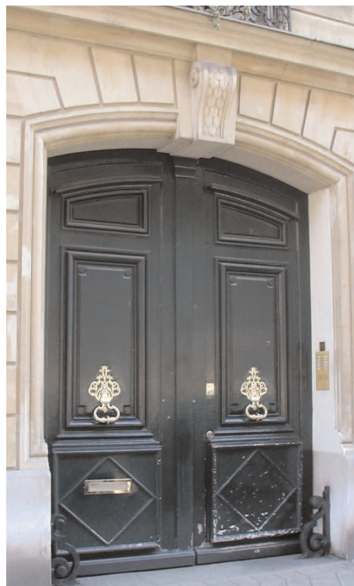
8bis, rue Marguerite