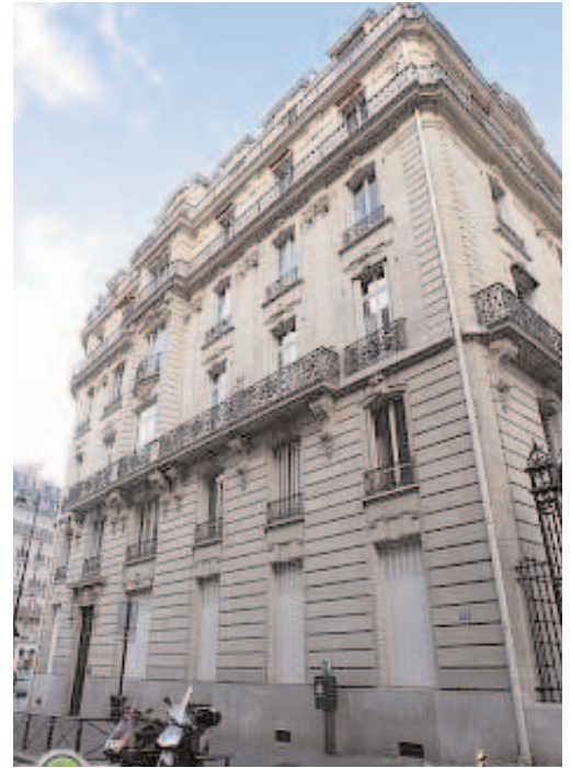
16, rue Margueritte (P.J).

Son enseignement basé sur l'apprentissage précoce des langues propose un programme bilingue à partir de la maternelle, avec des options d'enseignement en français ou en anglais comme langue principale, qui permettent à ses élèves d'obtenir des diplômes très recherchés, tant en France, en Grande-Bretagne qu'aux États-Unis. Les élèves de l'EAB venant des quatre coins du monde, un système informatique performant permet à leurs parents de suivre leurs études en temps réel depuis leur lieu de résidence.