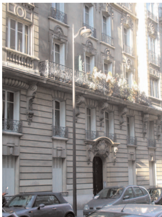
3, rue Marguerite