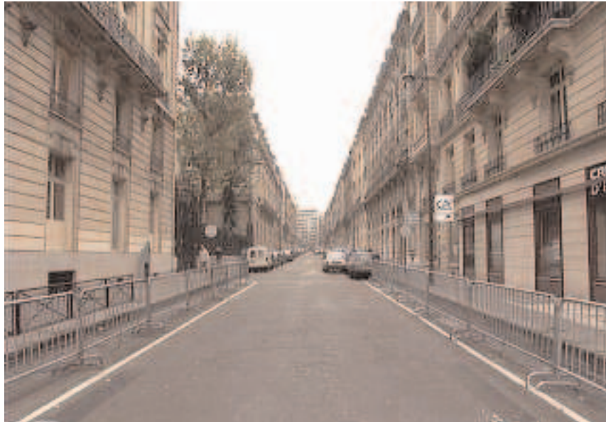
Rue Margueritte N°16 & 19 (PJ)

XVII e Arrondissement. Commence 104, bd de Courcelles, finit 76, avenue de Wagram et 2, rue Cardinet. Longueur 234 m. largeur 15 m. Ainsi que les rues Théodule-Ribot, Théodore-de-Banville, Gustave-Flaubert, cette rue a été ouverte, en 1892, sur l'emplacement de l'ancienne usine à gaz des Ternes-Courcelles qui remplissait tout le quadrilatère limité par le boulevard de Courcelles, les rues de Courcelles, Pierre-Demours, Rennequin et Des Renaudes. Cette usine occupait plus de 200 ouvriers, logés sur un terrain appartenant à un sieur Lombard, d'où le nom de cité Lombard porté par cette agglomération. L'avenue de Wagram séparait l'usine proprement dite, située sur son côté est, de cette cité Lombard située sur son côté ouest. Cette usine et cette dépendance ont disparu en 1890. La rue