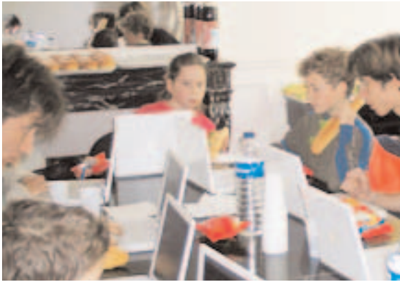
Une classe de l'EAB