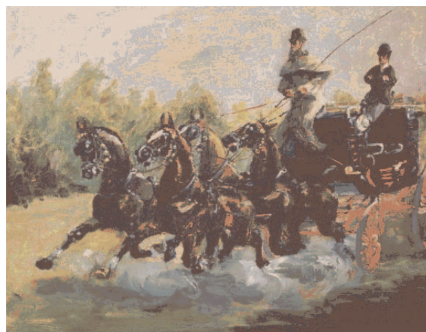
Alphonse de Toulouse-Lautrec-Monfa

Au temps que les boutiques de la rue Boissy-d'Anglas étaient closes par des volets de bois, il arrivait que les commerçants, en venant à leur magasin de grand matin, surprissent une scène étrange: un homme bien