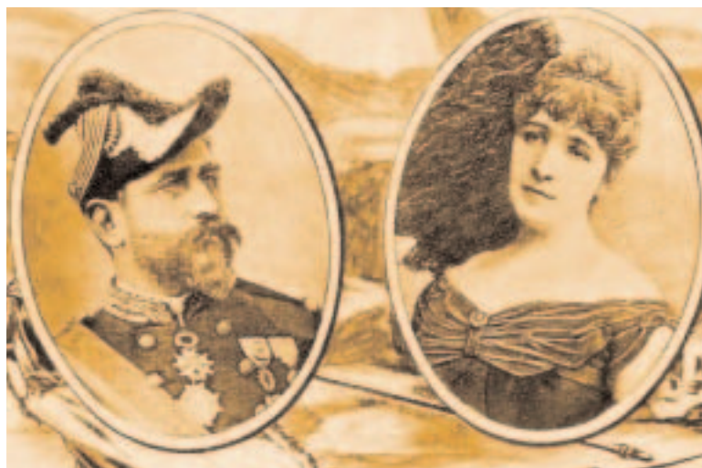
Général Boulanger et Mme de Bonnemains

Et voici qu'ils s'engouffrent dans la cité du Retiro, à cette heure-là parfaitement déserte et fort sombre. Pas si déserte qu'il y paraît puisqu'un policier les observe.