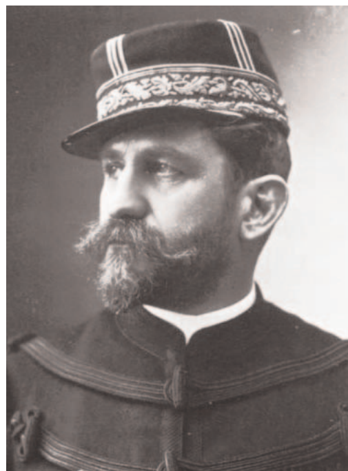
Général Boulanger par Nadar

A minuit passé, dans le cabinet particulier de Durand,