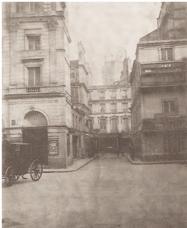
Cité du Retiro (vers 1900)

VIII e Arrondissement. Commence 30, rue du Faubourg Saint-Honoré; finit 35, rue Boissy d'Anglas. Longueur 236 m; largeur minimum 4 m.