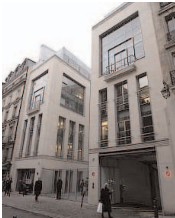
Entrée de la Cité par la rue Boissy d’Anglas

En 2005, la société Unibail cède l’ensemble immobilier de la Cité du Retiro à Bank of Ireland Private Banking pour 285 millions d’euros. La restauration conçue par Ricardo Bofill abrite entre autres le siège de Cartier International.