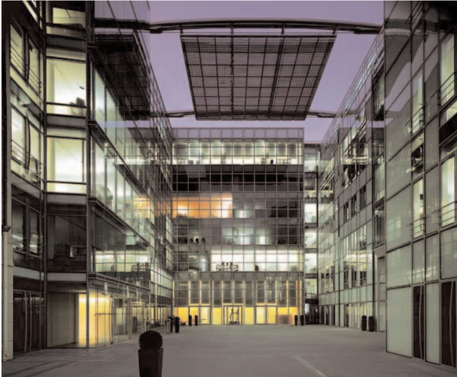
Un bain climatisé et aseptisé pour esclaves humains

Aujourd'hui, la charmante et romantique Cité du Retiro a été transformée par Messieurs les financiers, avec la complicité de promoteurs sans scrupules pour la beauté du site, en cet ignoble ensemble d'acier de verre dont les mendiants et les pauvres sont exclus, les arbres tricards, les moineaux, les chats de gouttière et les pigeons bannis !