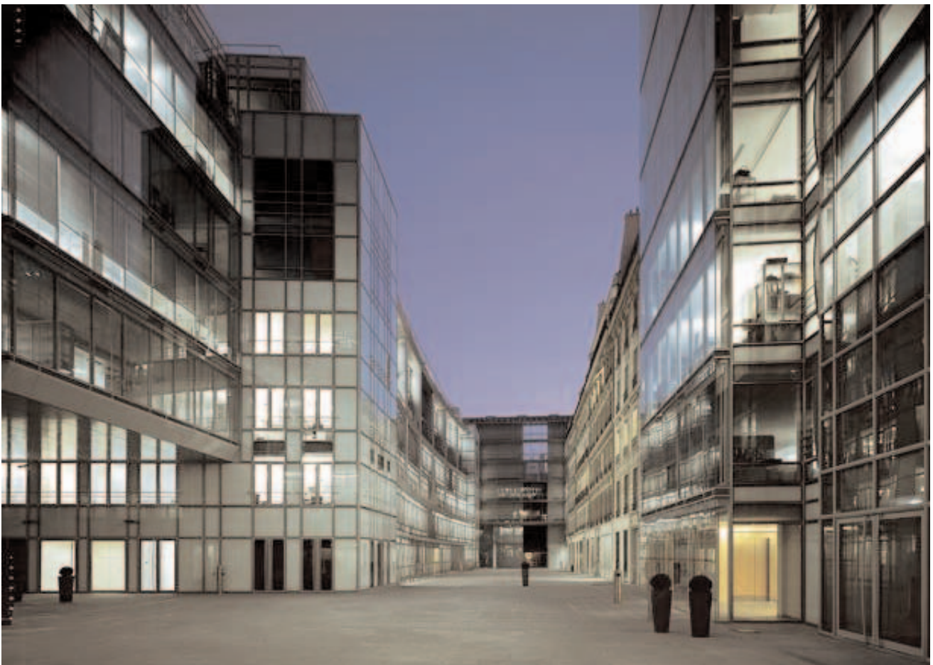
Cité du Retiro (2007) par Bofill