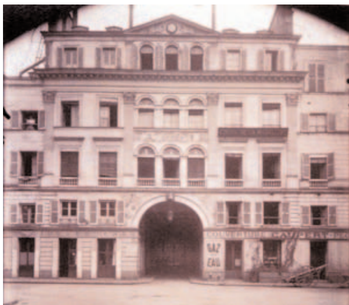
Cité du Retiro (1900) par Atget

Ah, le pauvre homme que voici a bien pu se retourner plusieurs fois pour s'assurer qu'il n'est pas suivi, il ne lui sera pas même permis de faire seul avec la femme adorée cet ultime pèlerinage.