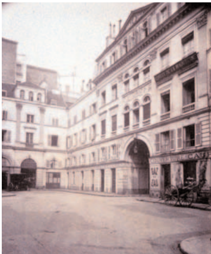
Cité du Retiro (1900) par Atget

Il comportait alors 12 remises, 8 écuries, une vingtaine de maisons dont un bal et un hôtel. Il était fermé, en 1850, par une grille sur la rue Boissy-d'Anglas, par une porte cochère sur le faubourg Saint-Honoré.