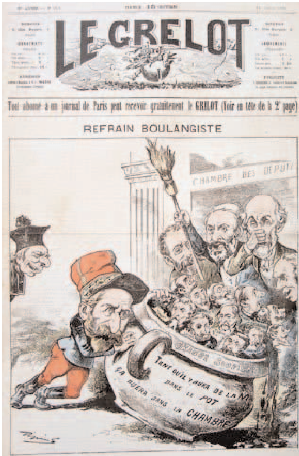
«Tant qu'il y aura de la vie dans le pot ça puera dans la Chambre !» Dessin de Pépin