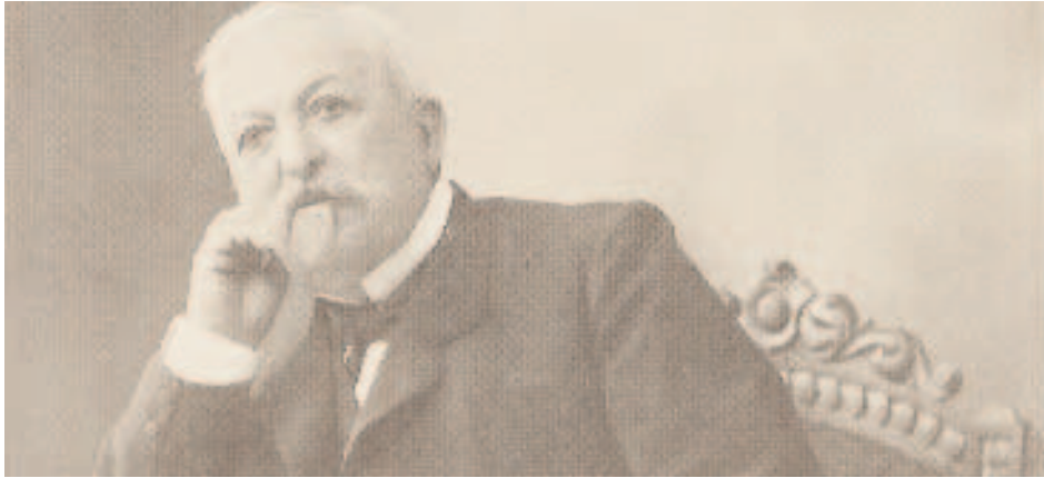
Ernest Constans (ministre de l'intérieur)