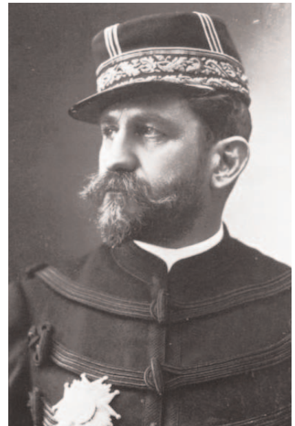
Général Boulanger