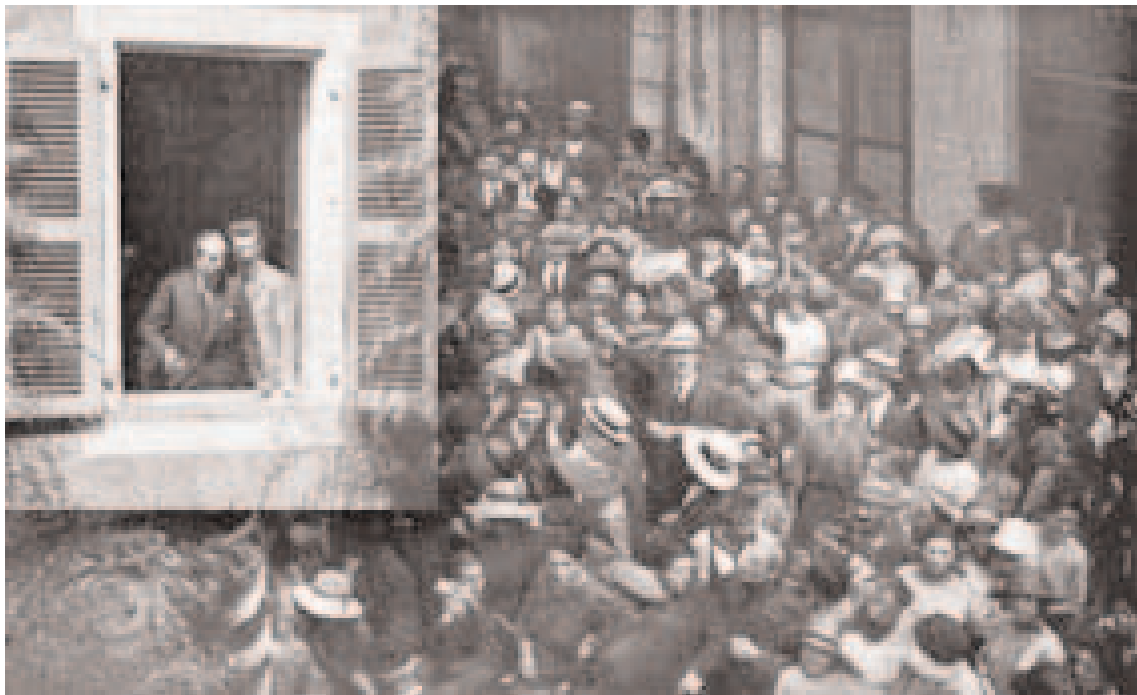
Georges Boulanger Idole de la foule parisienne