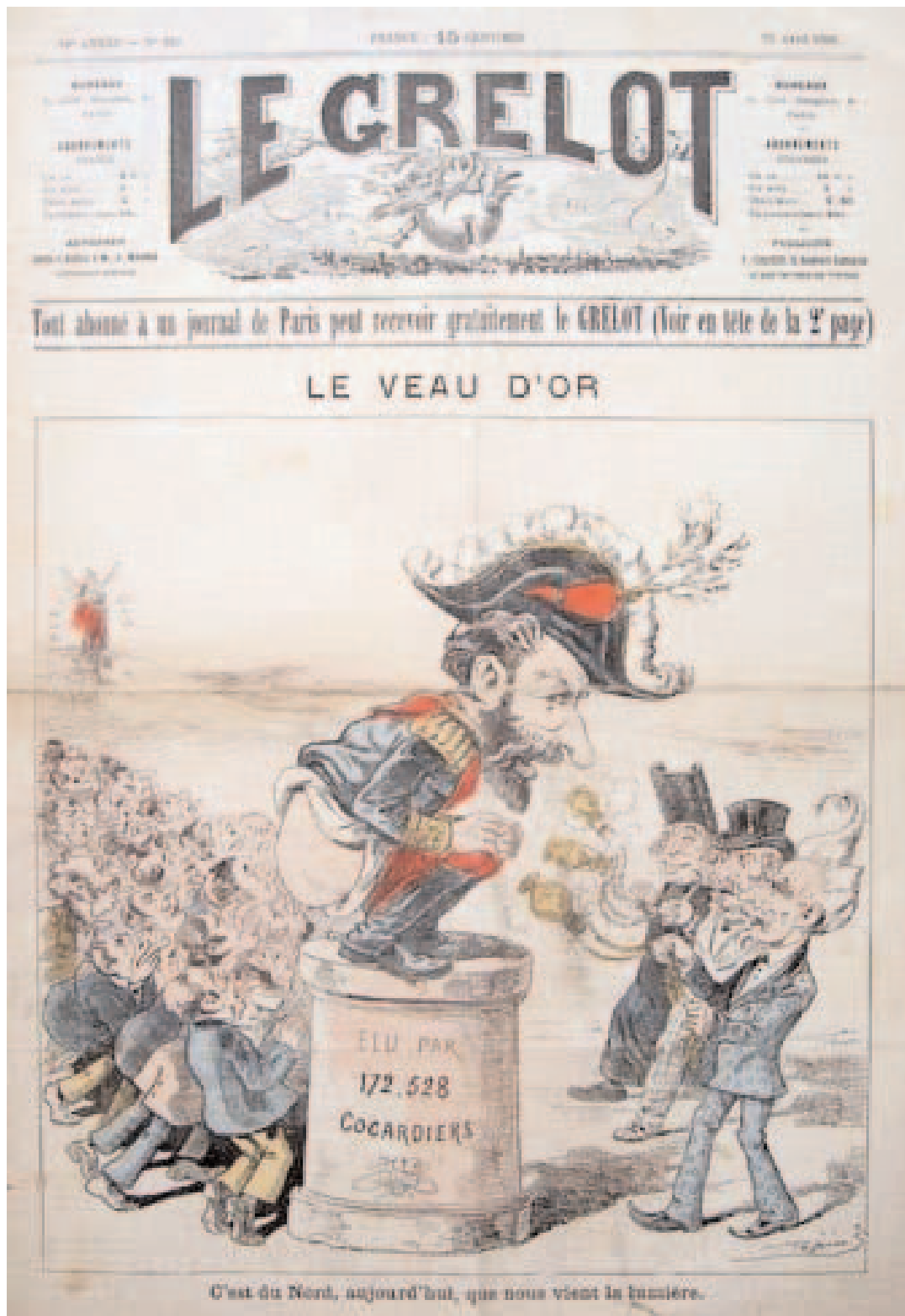
«C'est du Nord aujourd'hui que nous vient la lumière !» Dessin de Pépin