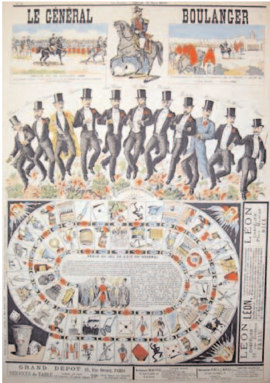
Le Général Boulanger Dessin anonyme du Figaro