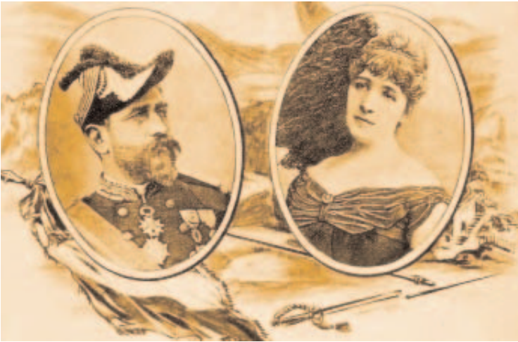
Georges Boulanger et Mme de Bonnemains

Vers neuf heures moins dix, la dame est sortie seule et a remonté la rue de Berri. Deux minutes plus tard, l'homme au manteau gris sortait à son tour. Il semblait méfiant et s'est retourné plusieurs fois. Il a rejoint la dame et lui a offert le bras. Ils ont pris le fiacre à la station de voitures de l'avenue Friedland. Et voici qu'ils s'engouffrent dans la cité du Retiro, à cette heure-là parfaitement déserte et fort sombre. Pas si déserte qu'il y paraît puisqu'un policier les observe. Ah, le pauvre homme que voici a bien pu se retourner plusieurs fois pour s'assurer qu'il n'est pas suivi, il ne lui