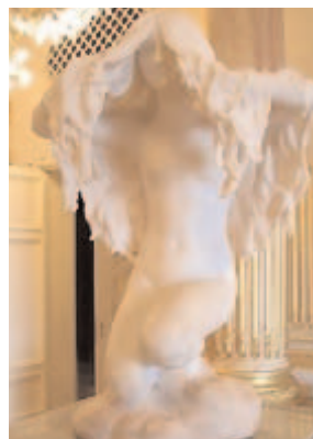
Denys Puech : Aurore

Considéré comme un artiste "pompié" par l'avant-garde, moqué par les Surréalistes, il s'intéressa de près à la politique, ce qui le fit mépriser par ses collègues moins bien en cour. En 1903, Denys Puech projette de construire un sanctuaire d'art aveyronnais à Rodez, musée qui sera inauguré en 1910. En 1925, il élabore le Monument de la Victoire de Rodez, aujourd'hui au jardin public. A la fin de sa vie, Denys Puech, se retire du monde pour se consacrer à une vie religieuse et spirituelle. Il meurt en 1942, un peu oublié.