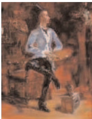
Princeteau par Toulouse-Lautrec

N° 23 : Immeuble d'ateliers-logement pour artistes construit vers 1930 dans le "modern-style" tardif. Belle porte en ferronnerie ornée d'une rosace et de deux poignées en forme de cobras .