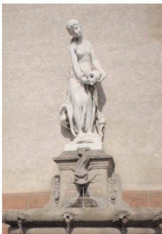
Denys Puech : Fontaine

N° 233/233 bis : Villa Wagram-Saint-Honoré.