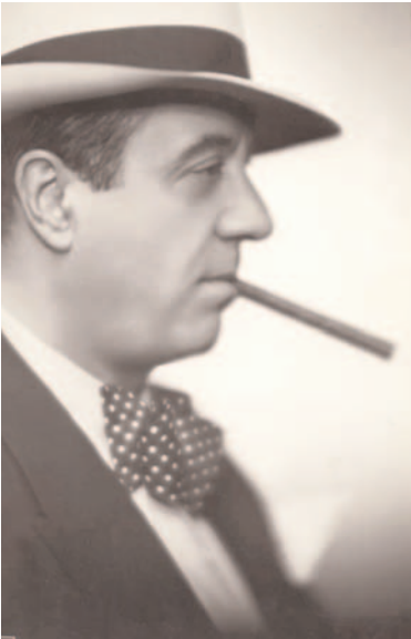
Raimu (dans les années 20)

destinée analogue à celle de la vaisselle plate royale, quand Louis XIV la faisait fondre pour faire face aux dépenses d'une guerre ruineuse... Naturellement, c'est parmi ceux qui s'y fussent les premiers laissés prendre que se trouvaient les plus acharnés à brocarder le conservateur du Louvre et ses collaborateurs.