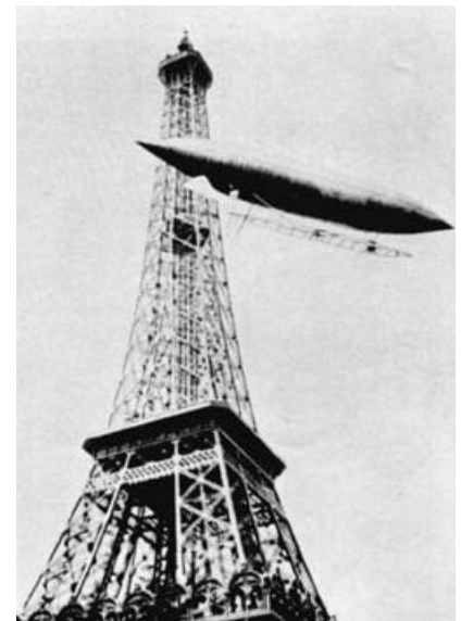
Santos en 1901 (à bord du N°6)

Petit ludion, vif, élégant, aimable, courageux, désintéressé, Santos Dumont fut l'une des plus pures figures de l'aviation naissante. En 1901, après s'être écrasé sur le restaurant du Trocadéro et avoir été sauvé par des pompiers lors d'une précédente tentative, l'aéronaute distribua aux nécessiteux de Paris une grande partie du prix de 100.000 francs qu'il remporta en accomplissant en moins de trente minutes un circuit aller et retour de 11 km entre Saint-Cloud et la tour Eiffel à bord de son dirigeable.