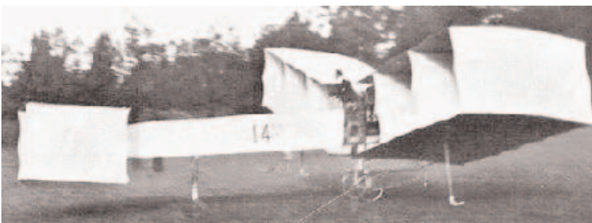
Le « 14 bis »

Plus tard, il réalisera le rêve un peu fou d'atterrir sur les Champs-Élysées, à deux pas de chez lui, pour aller boire une fine à la terrasse d'un café avec ses amis!