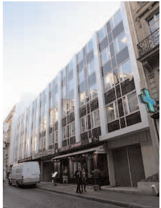
14-16 rue Washington (PJ)

Elle quitta son socle et sa vitrine et le directeur du Louvre, terriblement gêné, la fit disparaître dans les réserves. Qu'est-elle devenue ? Elle était en or, ce qui lui a peut-être assuré une