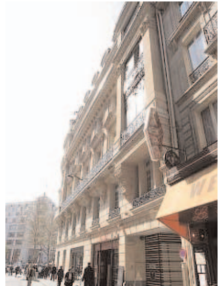
1, rue Washington (au fond Champs-Élysées)

N° 9 : Alberto Santos-Dumont* (1873-1932), pionnier de l'aviation, résida ici entre 1898 et 1905. Son père, ingénieur des Arts et Métiers d'origine française, était constructeur de chemins de fer et