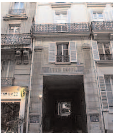
N° 34 Cité Odiot