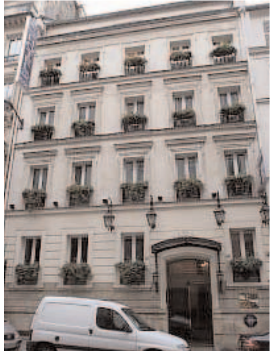
45, rue Washington

N° 42/44 : Le Washington plaza (ancien building Shell) s'étend entre les rues Washington et d'Artois, jusqu'au N° 29 de la rue de Berri. L'immeuble conçu avant la dernière guerre par les architectes Bechamann et Chatenay, souhaitait transposer à l'échelle parisienne un building d'affaires new-yorkais, en utilisant des techniques de construction de pointe, aménageant des installations perfectionnées de chauffage, ventilation, ascenseurs. La monumentale galerie commerciale est aujourd'hui fermée au public.