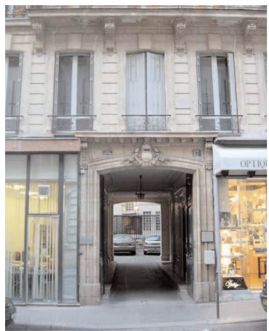
17, rue Washington