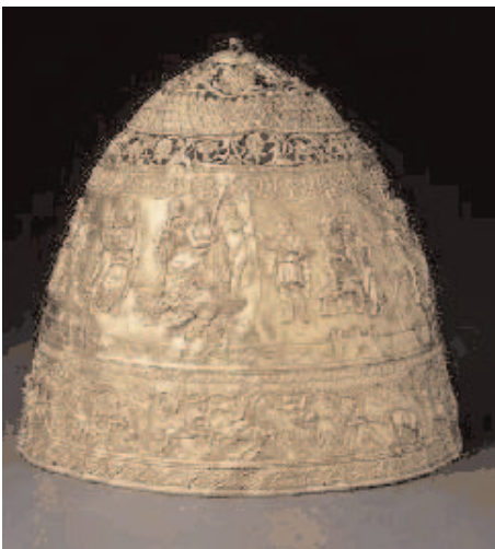
Tiare de Saïtapharnès

Or on fut bientôt avisé par un savant russe et par un érudit germanique que la tiare était un faux! Mais nos experts n'admirent pas aussi facilement qu'ils s'étaient laissé tromper. Il y eut les tenants de l'authenticité et ceux qui voulaient monter l'affaire comme un immense canular. Comme le baron de Rothschild cessait brusquement de s'y intéresser, un autre acheteur se présenta en la personne de Barnum, qui câbla d'Amérique, offrant 200.000 francs de la tiare si on lui prouvait qu'elle était fautive! Elle eût enrichi sa galerie de phénomènes.