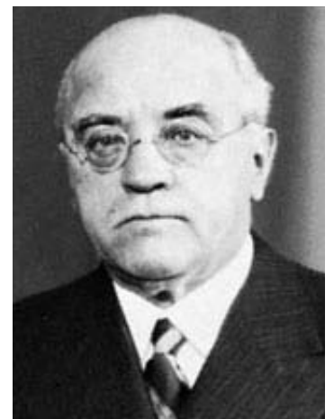
Albert Sarraut (1872-1962)