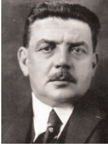
Édouard Herriot (1872-1957)

- 11 juillet. - La rancune d'Aristide amenuise la cérémonie de l'inauguration du monument Gallieni sur l'esplanade des Invalides, amaigrit et bâcle ses défilés. Le « Président » se souvient qu'il a tremblé pour son gouvernement en 1916.