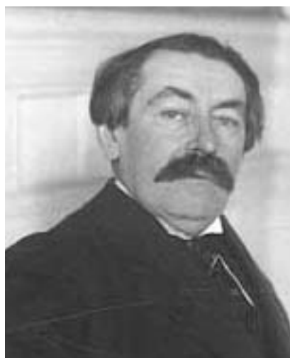
Aristide Briand (1862-1932)

Annaliste soucieux de fixer la petite histoire - plus exacte souvent que la grande - je voudrais recopier ici les notes résumées d'un semestre d'intrigues parlementaires pour en montrer le mécanisme rouillé, ramenant sans cesse les mêmes auges de noria sous le déversoir du puits à maroquins. Pourquoi changerais-je la rédaction de mon éphéméride, dans sa concision sans apprêt?