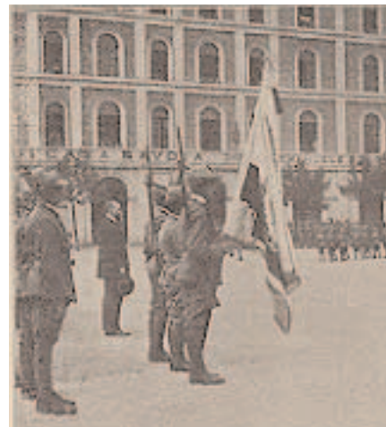
Henry-Simon ministre des Colonies