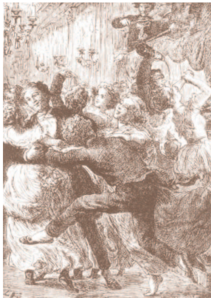
Freyschütz de Weber

- Mon vieil ami, me dit-il, je vous félicite et je vous remercie. Vous voilà revenu à votre vraie vocation.