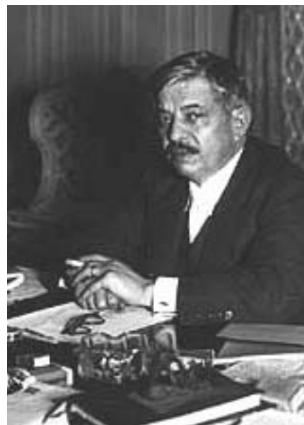
Pierre Laval (1883-1945)

C'est moi qui, le premier, à Versailles, ai annoncé à Briand son échec. Je revenais de la salle de dépouillement et avais totalisé rapidement les voix de chacun des bureaux: celles du président du Sénat