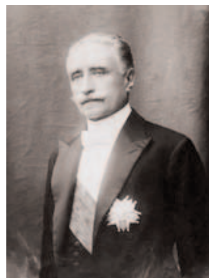
Paul Deschanel (1865-1922)

- Il ignore, le cher vieil homme, me confia Tardieu quand je lui rendis compte d'une entrevue qu'il m'avait conseillée, que mon dîner se compose d'un bol de consommé et de deux oranges. Répondez-lui combien je suis sensible à sa sollicitude et rassurez-le tout de suite.