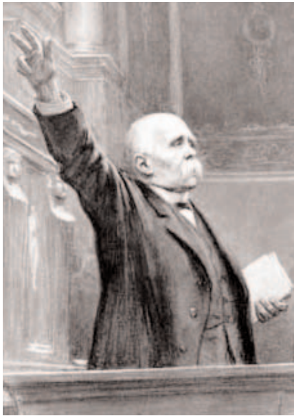
Georges Clémenceau (1841-1929)

réélu à l'infini, tout en fonçant sa couleur progressivement, distançant les socialistes désorganisés et les réactionnaires sans chefs.