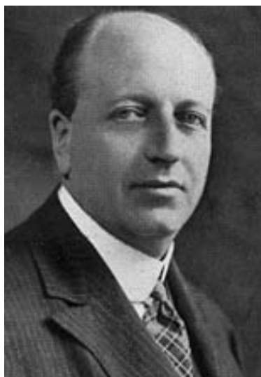
Maurice de Rothschild (1881-1945)