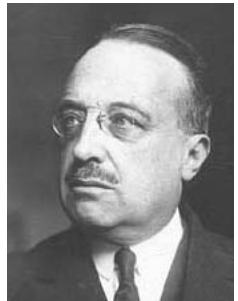
André Tardieu (1876-1945)

- Je sais, me chuchota-t-il, que Tardieu vous avait pressentis tous les deux pour remanier avec lui son gouvernement. J'avais moi-même essayé de persuader mon vieil ami de se prêter à cette refonte: elle aurait précédé de peu un nouveau Congrès pour la révision de la Constitution. Tardieu en avait déjà, avec