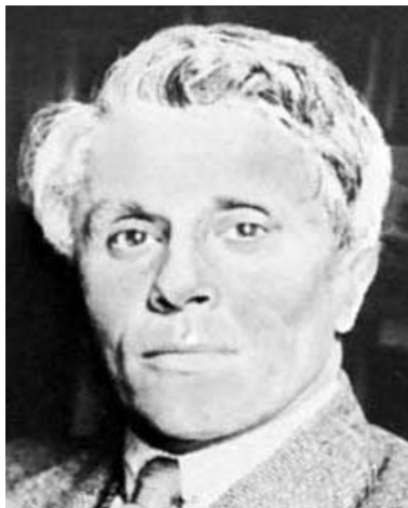
Joseph Paul-Boncour (1873-1972)